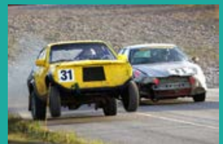
Tänä kesänä Risten radalla riittää jälleen pärinää.

- Alueella tehdään säännöllisesti pohjavesitutkimus, ja varikko on asfaltoitu. Kuljettajilla on varikolla käytössä kilpa-auton alla nesteitä läpäisemätön pressu ja imeytysmatto. Ratatoimitsijat ja palokunta hoitavat ratatapahtumia, jotta mahdolliset öljyvuodot eivät aiheuta haittaa ympäristölle. Meillä on tapahtumissa myös nimetty ympäristövastaava ja ongelmajätteille varatut kierrätys-