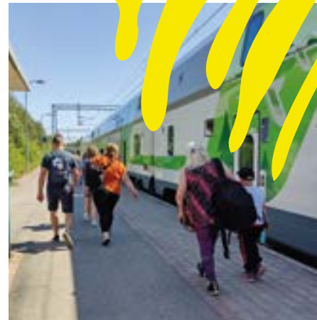
Vilkasliikenteisen Kokemäen rautatieaseman seutu on jatkossa helpommin tavoitettavissa.

Kokemäen rautatieaseman seudulle tehdään muutoksia osana väyläviraston hanketta, jossa parannetaan Tampereen ja Porin välisten tasoristeysten turvallisuutta. Ehdotuksen myötä myös kulkuyhteydet asemal-