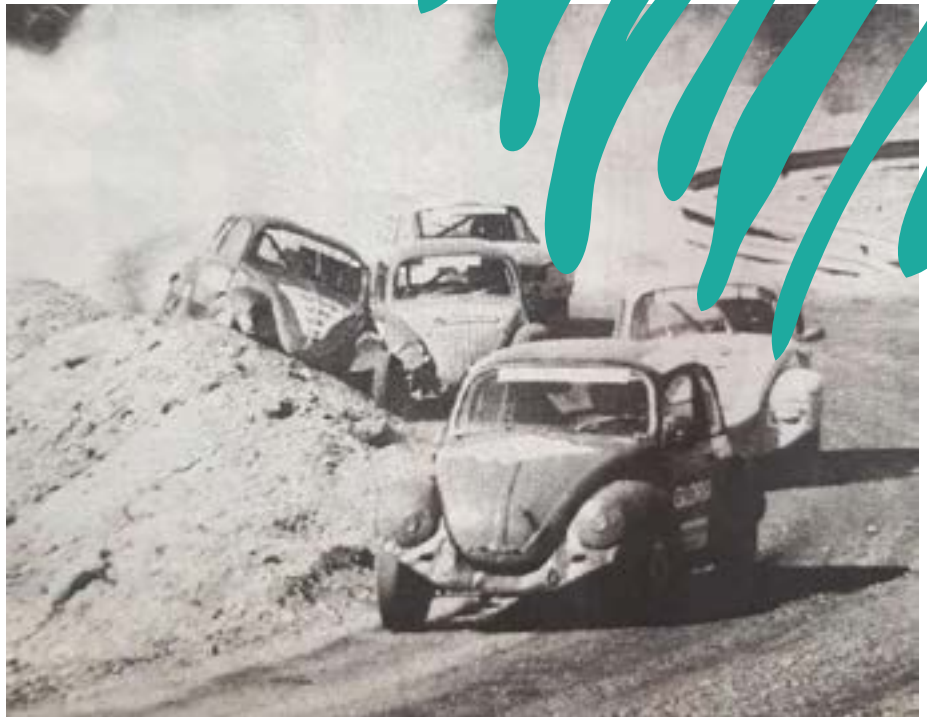
Jokkista Kokemäellä jo yli 40 vuotta - Kokemäen urheiluautoilijat ry:n perustava kokous pidettiin 12.9.1980. Vuonna 1984 pidettiin Risten radan ensimmäiset kisat, Kokemäen kuhmut, keräten 1200 katsojaa.