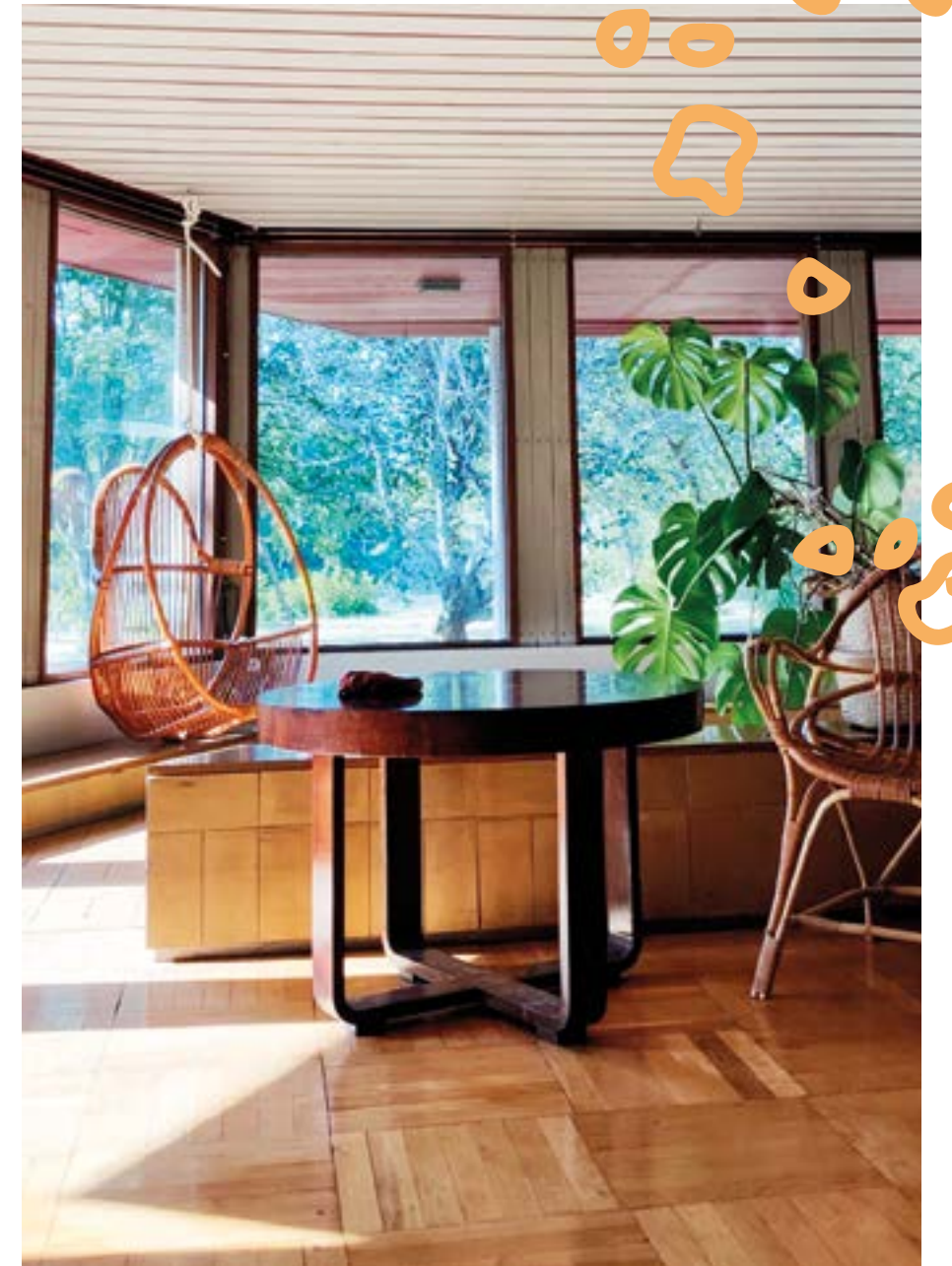
Olohuoneen arkkitehti ja sisustusratkaisut henkivät 60-luvun innovatiivisuutta ja luovuutta.

”Lajin pariin päädyin varmaankin Risten koulun liikuntatunneilta. Liikuntasalia oli mahdollista käyttää myös koulun ulkopuolella, sillä erään nimeltä mainitsemattoman koulukaverin äidillä sattui olemaan avain koululle. Salissa pelattiin ahkerasti myös kaikkia muita mahdollisia pallopelejä. Yläasteella liikunnanopettajan rohkaisemana uskalsin mennä oikeisiin salibandytreeneihin, ja sieltä se kipinä sitten lähti. Pelinumeroni 66 tulee muuten tältä liikunnanopettajalta, joka lajin pariin silloin rohkaisi. Tosin ensirakkaus oli ehdottomasti pesäpallo, jota edelleen seuraan aktiivisesti.”