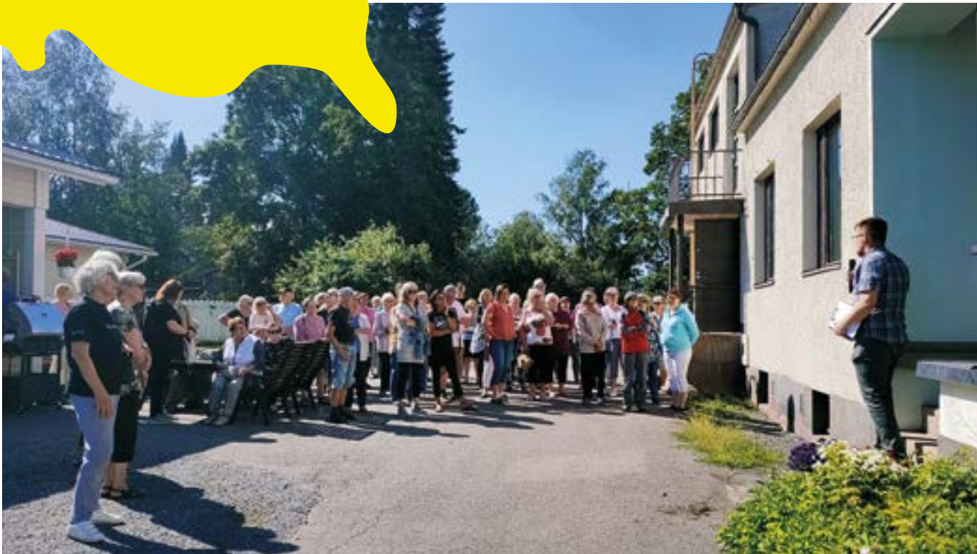
Kokemäen talojen tarinat -tapahtumasarjan suosio on kasvanut vuosi vuodelta. Talo Suvannon avaustarinoinnissa kesällä 2022 vieraita kerääntyi kahdeksankymmentä.

Kulttuuriympäristöjen Kokemäki kutsuu kylään!