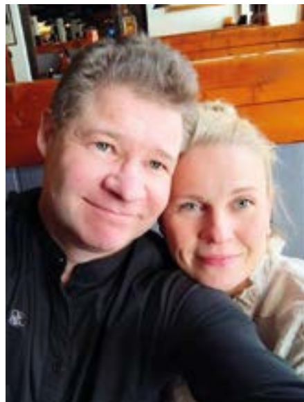
Yrittäjäpariskunnalla on edessään ikimuistoinen kesä, sillä ravintolan pyörittämisen lisäksi he tanssivat myös omia häitään.

”Meillä käy viikonloppuisin kymmeniä perheitä ruokailemassa ja Kiilin-