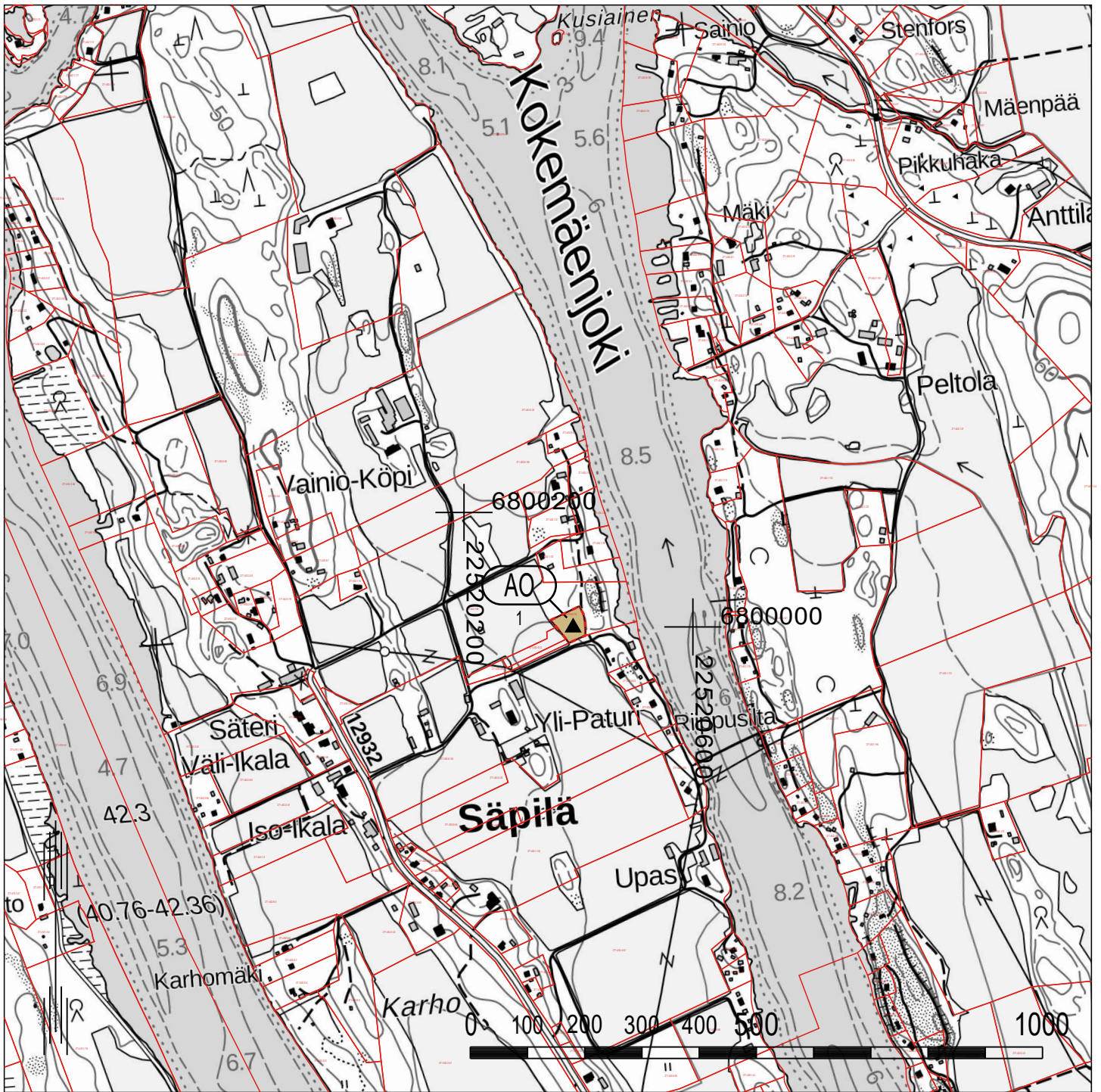
Kaavan taustakarttana on käytetty Maanmittauslaitoksen rasteriperuskarttaa ja kiinteistörekisterikarttaa.