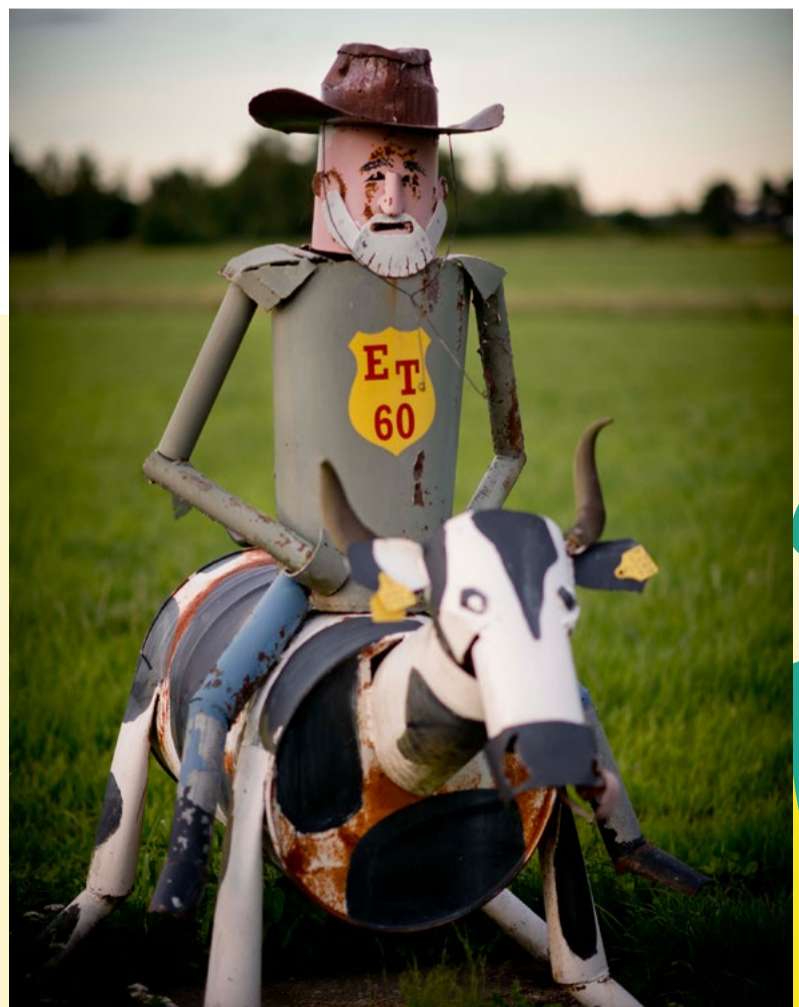
Rautaäijä Toikan ja hänen rautalehmänsä voi bongata kirjaamassa Kuuroolan pellolla.