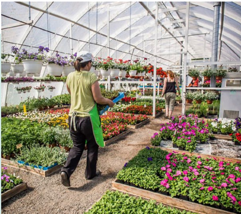
Prehtin Puutarhalla on laaja valikoima erilaisia lajikkeita hyötykasveista kukkasiin.