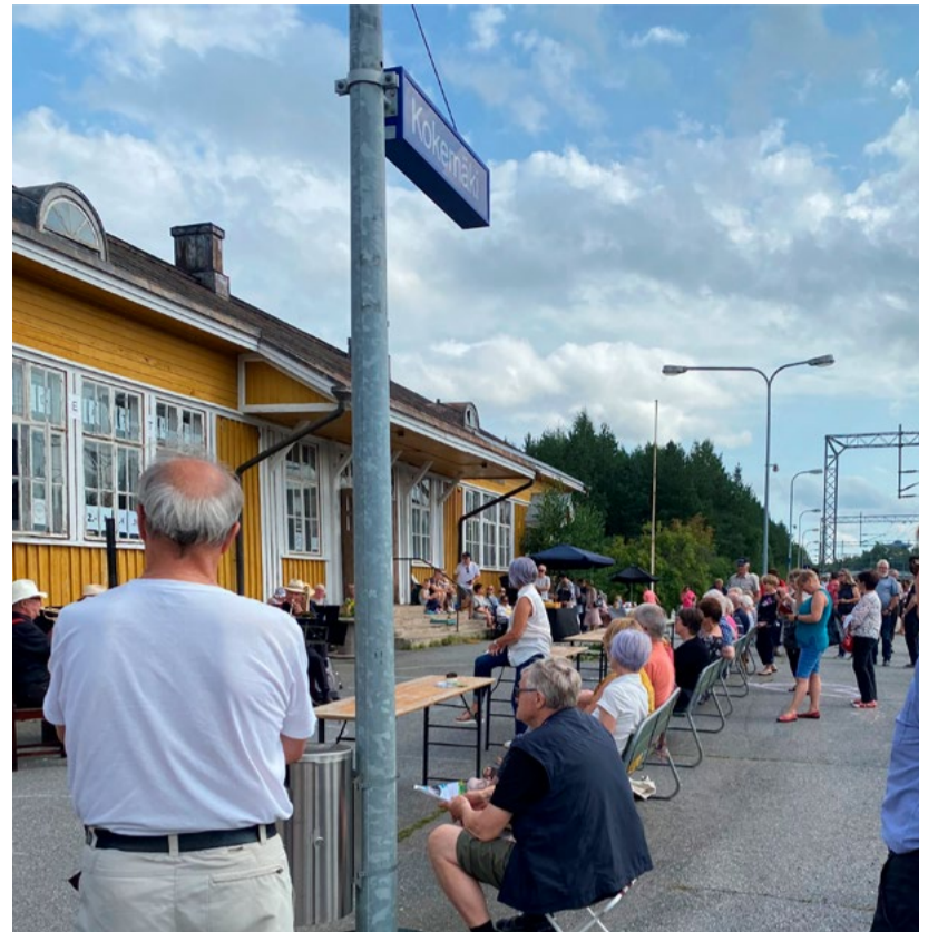
Kyläkeskuksenakin toimivalla Peipohjan asemalla on järjestetty jo taidenäyttely, musiikkikonsertteja ja hyvinvointikursseja.