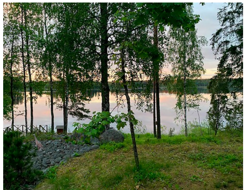
Kauvatsan Lievijärven rannan upeassa maisemassa kelpaa nauttia kesäillasta yhdessä mökkiystävien kanssa.