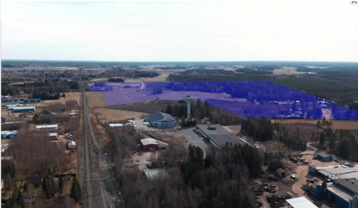
Kirkkokallion asemakaavan alue Kokemäen ratapihalta kuvattuna 4-2021.

Jokaisen vaihtoehdon raide on ehdotettu lähtemään Kokemäen asemalta, jossa on jo olemassa vaihdeyhteys (vaihte 005).