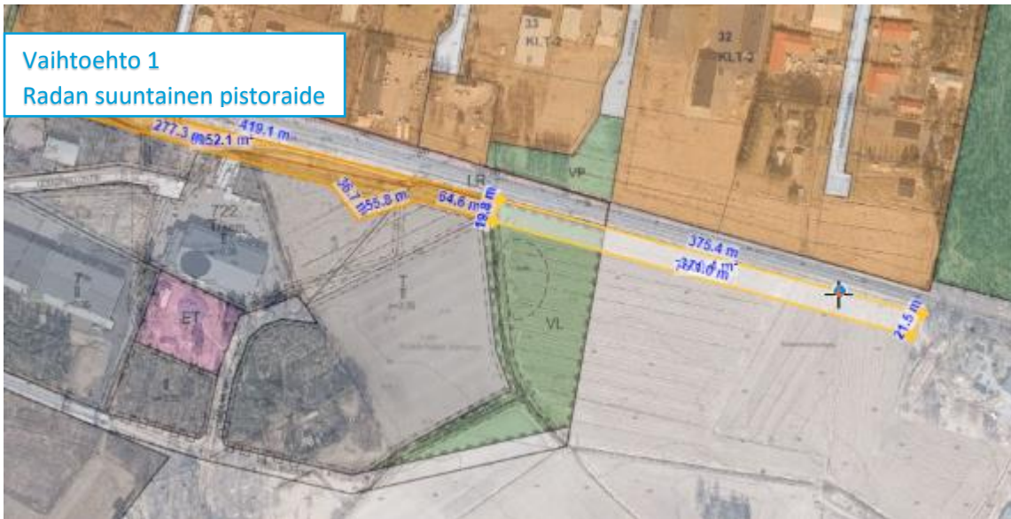
Vaihtoehto 1 Radan suuntainen pistoraide